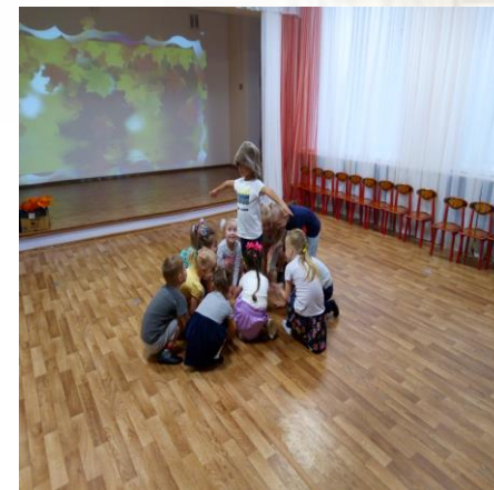
Игра с пением: «Пугало»