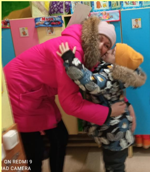
ON REDMI 9 AD CAMERA