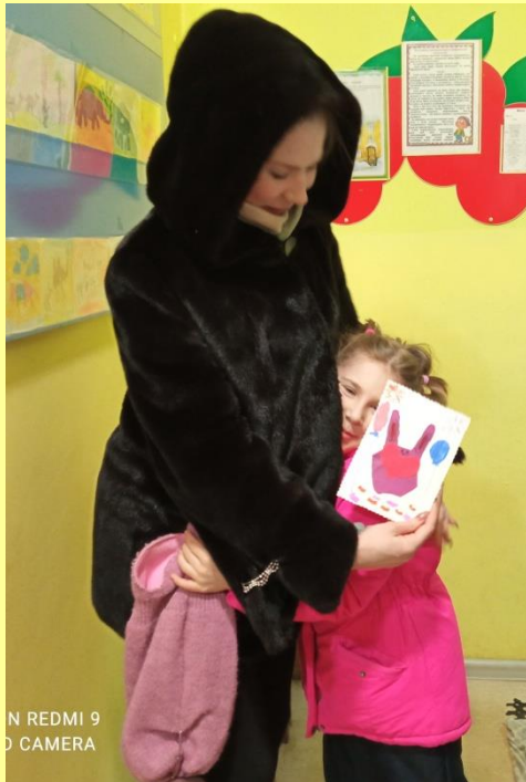
N REDMI 9 D CAMERA