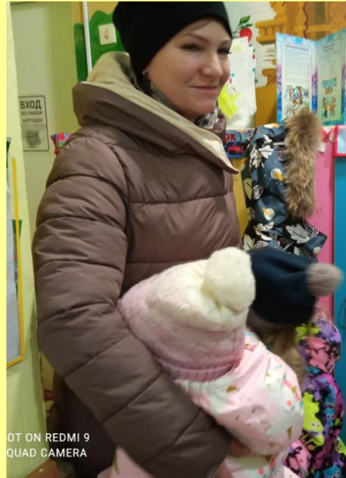
OT ON REDMI 9 QUAD CAMERA